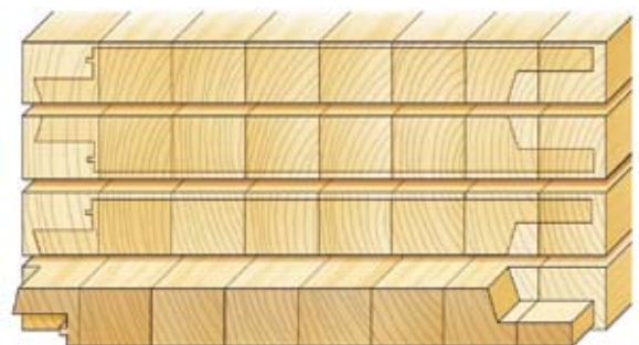
Formstabil Eftersom trä rör sig mindre radiellt än tangentiellt gör de stående årsringarna att rörelsen i panelen minimeras, vilket gör att den inte kumar sig eller spricker.

Tack vare limträpanelens bredd ges arkitekter och andra kreatörer stora möjligheter att forma unika byggnader.