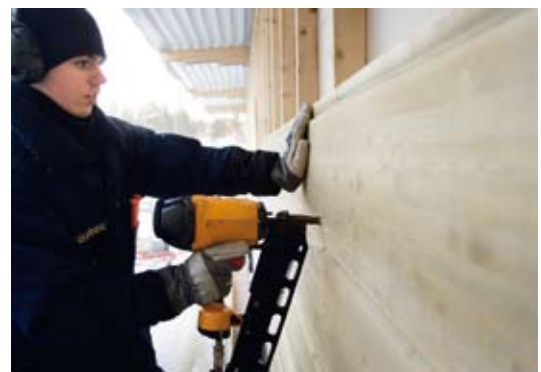
Enkel montering En limträpanel monteras precis som en vanlig panel, med spik eller skruv. Genom att välja en panel med ändspont kan montaget utföras ännu mer effektivt.