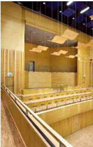
Byggnader med limträstomme erbjuder stora möjligheter till många synliga trädetaljer och behagliga inomhusmiljöer.

Martinsons stomsystem i limträ är perfekt för byggnader med stora fria ytor, allt ifrån affärslokaler och sporthallar till industrilokaler och lantbruksbyggnader. Stommarnas bärförmåga ger frihet och möjlighet till lösningar med öppna ytor och ett begränsat antal pelare.